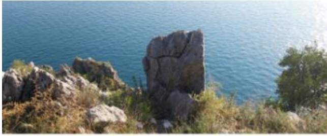
Seminar geomantija Pomlad 2020