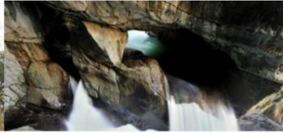
Seminar vodi Robi Lavin